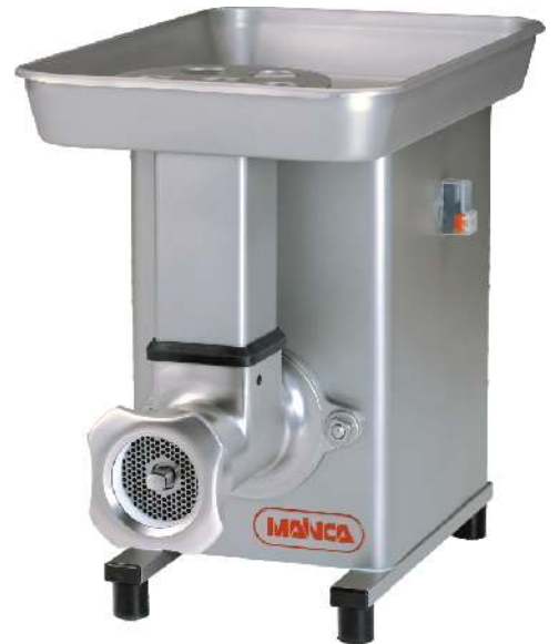
PM-114 PM-98 / PM-32