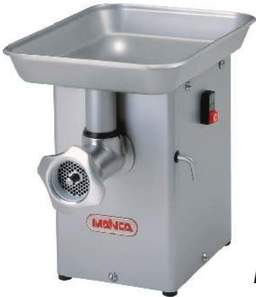
PM-70 / PM-12