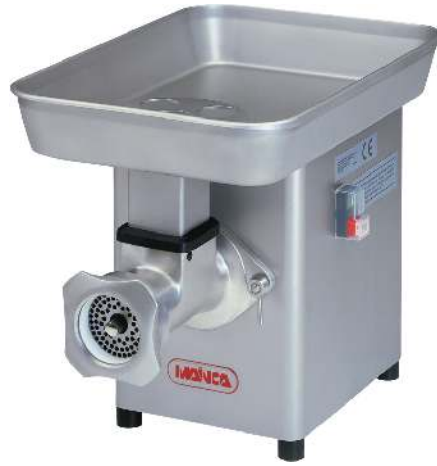
PA-82 / PA-22 PM-82 / PM-22