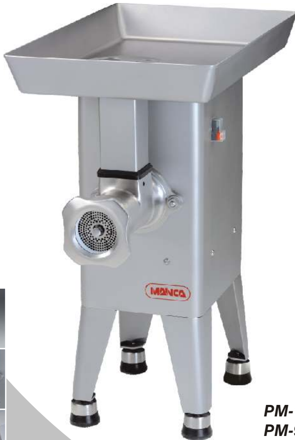
PM-114L PM-98L / PM-32L